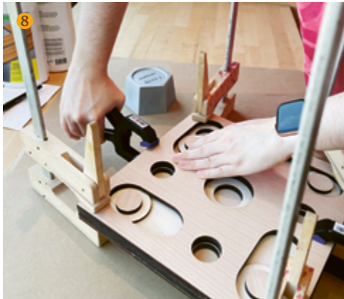
Holzplatten zusammenleimen und fixieren