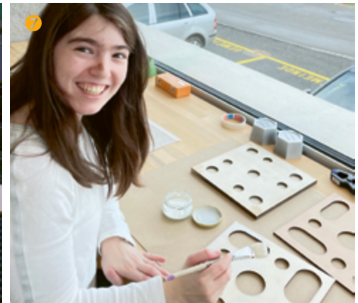
Gulia klebt die verschiedenen Holzplatten zusammen