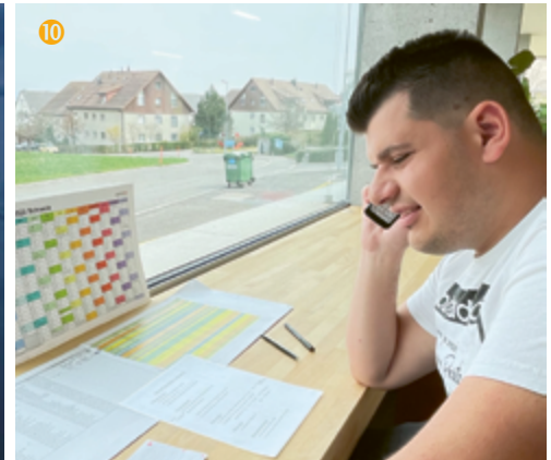
Marko akquiriert mit Freude Neukunden

chen oder Frauchen? Diverse Testpersonen erstellen Videos ihres Hundes, während er sich mit den Spielen vergnügt und schliesslich wird «Zuma» ausgewählt (Bild 1) – sie repräsentiert am Besten, wie «Hund» damit umgeht. Dazu muss man wissen, dass jeweils unter den Schiebern oder Zapfen der Spiele kleine Belohnungen in Form von Goodies versteckt sind, welche den Hund natürlich enorm motivieren, sich an die Arbeit zu machen!