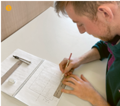
Nicola sucht die besten Lösungen zur Umsetzung